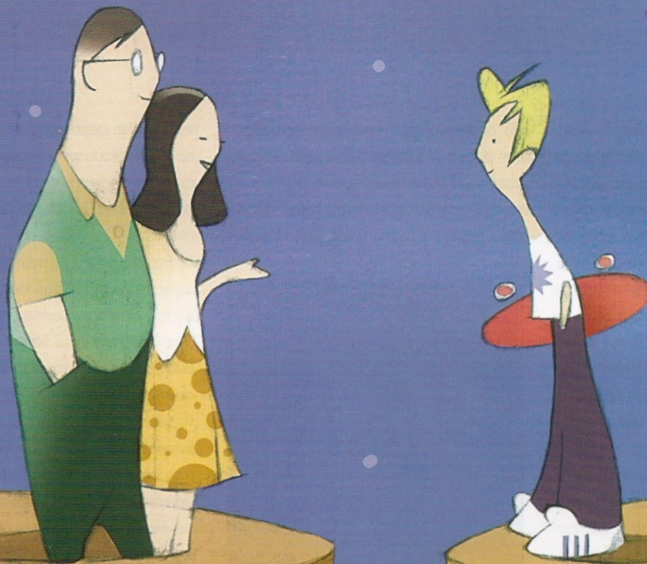
Ilustración: Sebastián Dufour